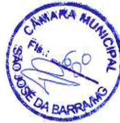
JOSILENE APARECIDA COSTA CONTADORA 1100870