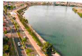
Avenida Beira Rio -Itumbiara/GO

Câmara Municipal de S. José da Barra/MG Pela aprovação 08 votos favoráveis; 00 votos contra; 00 ausência; 00 abstenção