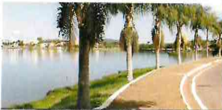
Calçadão de Boa Esperança/MG